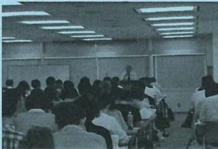
※過去の講義風景です

定価 ¥ 16,000のところ 特別割引! 全国住宅産業協会会員 ¥11,000 (税込)