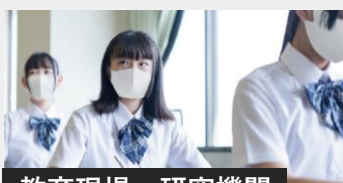
教育現場・研究機関

お客様訪問がある接客クルーやどうしても出社せざるを得ない職場でも、安心して働けることを目指します。