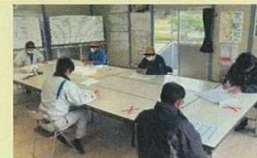
打合せ時の十分な対面距離の確保