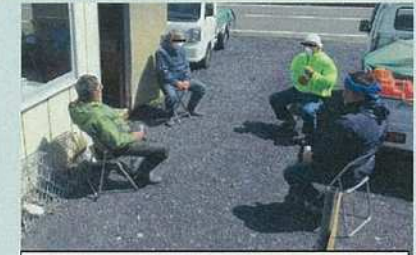
屋外で対人距離を確保して休憩