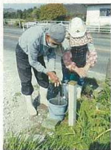
作業場所での手洗い励行