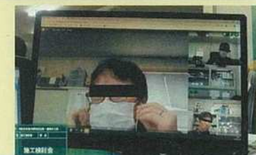
Web会議による打合せ