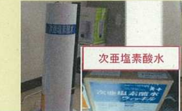
次亜塩素酸水対応の加湿器等を設置