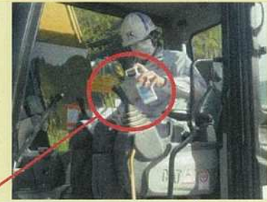
ハンドルやレバー等のアルコール消毒の徹底