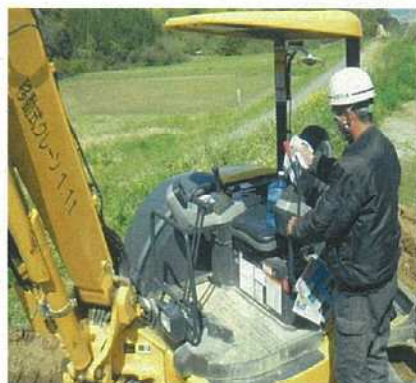
重機のレバーはこまめに消毒