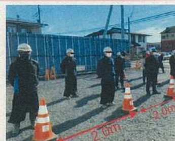
作業員間の一定距離の確保