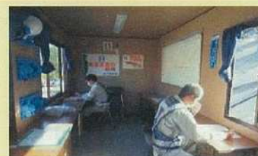
現場事務所での対人間隔の確保と換気