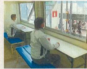
休憩室の窓の常時開放