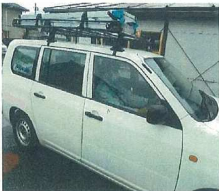
現場移動では同乗を避けて 個人で移動