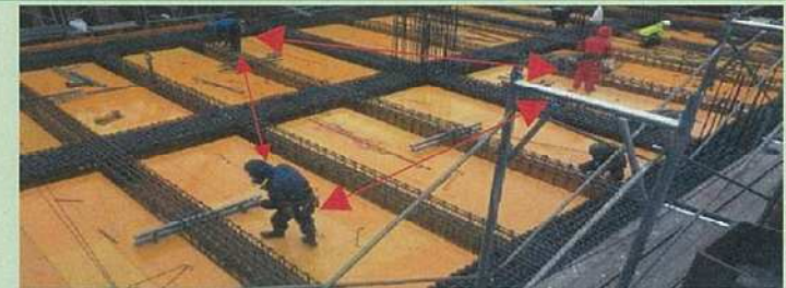
作業員の配置をブロック分けし密接した作業を回避