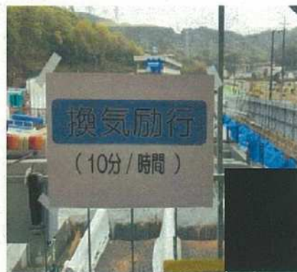
作業場所は定期的に換気する