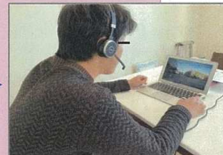
テレワークでの現場確認状況

テレワーク中の担当者でも、自宅でPC等で確認・指示・注意を行うことができ、テレワークの活用と現場における対人接触の低減に資する