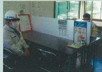
パーティションで密接を防止