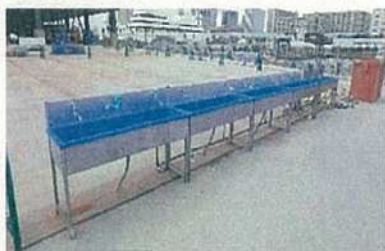
現場の手洗い場所の増設