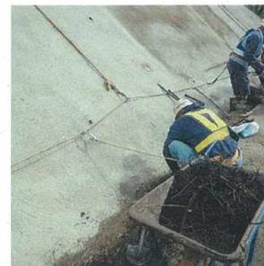
作業時なるべく離隔を確保