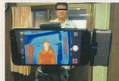
サーモグラフィカメラによる体温計測