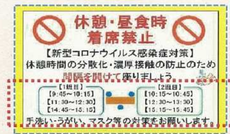
時間差による休憩時間の分散化