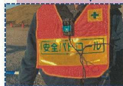
携帯Webカメラ着用状況