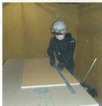
作業時のマスク着用