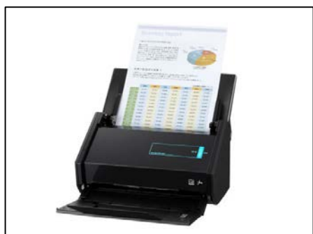
①スキャナーや複合機等でデータ化