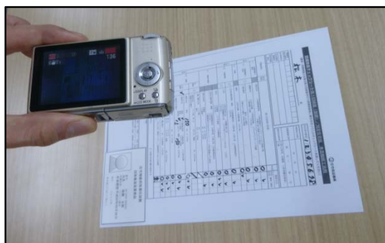
②デジカメで写真撮影