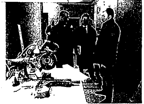
ハバロフスク市(ロシア連邦)よりの見学者

全住協第48回全国大会(札幌)には多くの方々にご参加を頂くことと存じますが、折角の機会ですので、10月2日(金)10時から14時の予定で、木造住宅見学会を開催致します。