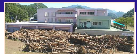
平成28年台風10号により、岩手県の要配慮者利用施設では利用者9名の全員が死亡。